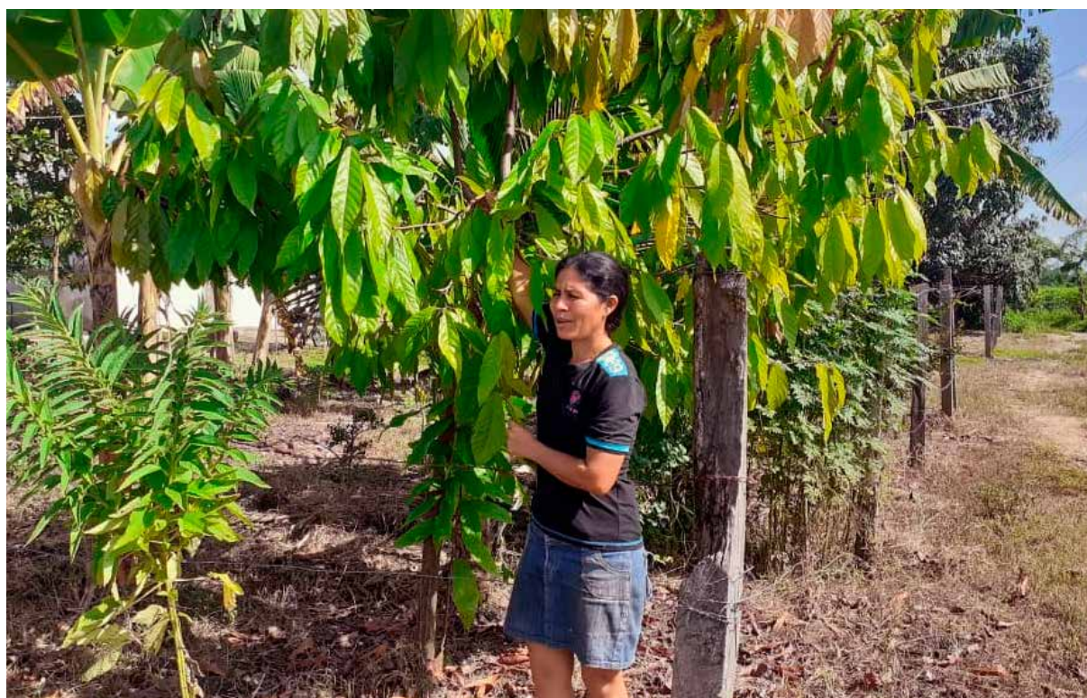
Nombre Productora: Noris Camacho (Municipio San Genaro de Boconoíto, Estado Portuguesa)

Aunque las mujeres rurales representan el 45,72 % de la población rural, sus condiciones sociales, económicas y políticas distan mucho de ser igualitarias, ya que las barreras económicas, sociales y políticas que afrontan limitan sus posibilidades de salir airoso de los riesgos que conlleva su accionar en el sector (rol reproductivo-productivo-comunitario).